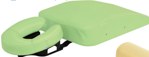
i ボディマットPro(プロ)